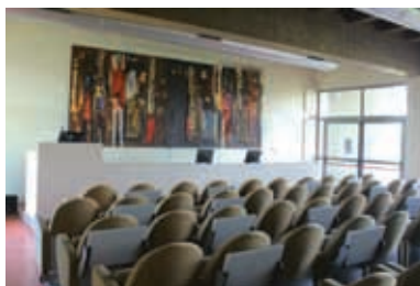
La Sala conferencias