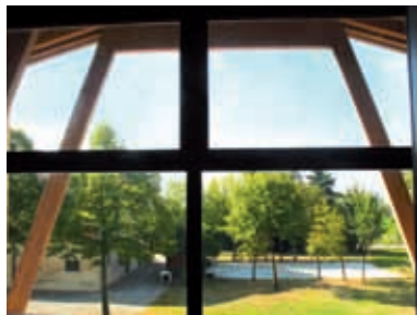
Vista al Parque