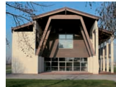
El lado frontal de la Biblioteca