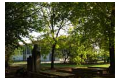
El Parque Agroambiental