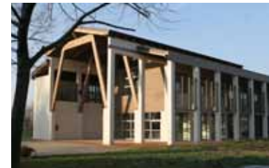
La estructura del Edificio